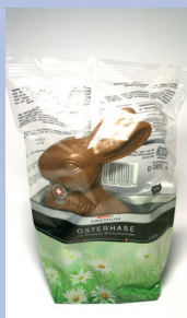
Spar Premium Riesen-Osterha- se aus Schweizer Milkschokolade Gütesiegel: UTZ