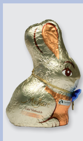
Monarc Edel Vollmilch Medaillon Sitzhase (Hofer) Gütesiegel: Fairtrade Cocoa Program