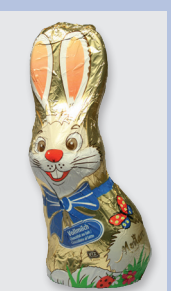
Monarc Vollmilch- schokolade (Hofer) Gütesiegel: UTZ