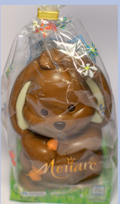
Monarc Fröhliche Ostertiere - Hase (Hofer) Gütesiegel: Fairtrade Cocoa Program