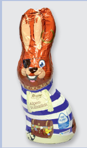
Douceur Alpen Vollmilch (Penny) Gütesiegel: Fairtrade Cocoa Program