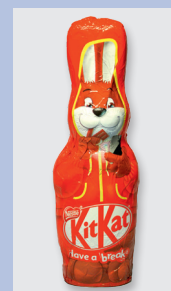
KitKat Osterhase Gütesiegel: keine