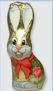
Friedel Sitzhase (Müller) Gütesiegel: Fairtrade Cocoa Program