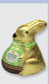
Ferrero Rocher Milkschokoladen- hohlkörper mit Ha- selnussstückchen Gütesiegel: keine