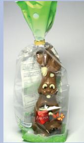
Favorina Confiserie Osterhase Zartbitter (Lidl) Gütesiegel: Fairtrade Cocoa Program