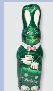
After Eight Osterhase Gütesiegel: keine