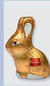
Favorina Edel-Vollmilch- Schokolade (Lidl) Gütesiegel: Fairtrade Cocoa Program