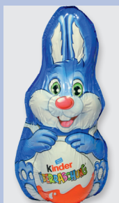
Kinder Vollmilchschokola- denhohlkörper mit Milchcreme Gütesiegel: keine