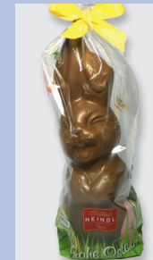
Heindl Lachhase Vollmilch Gütesiegel: Fairtrade Cocoa Program