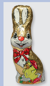
Riegelein Confiserie Vollmilch-Schoko- lade Gütesiegel: Fairtrade Cocoa Program